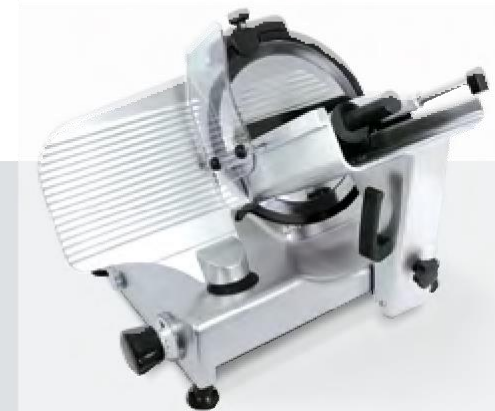
VERSIONE NERA BLACK VERSION